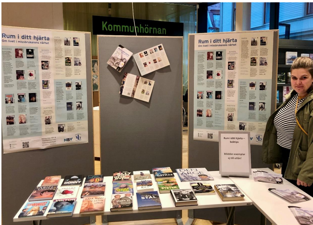
Nypremiär för bokutställningen Rum i ditt hjärta på kulturväven i Umeå i oktober