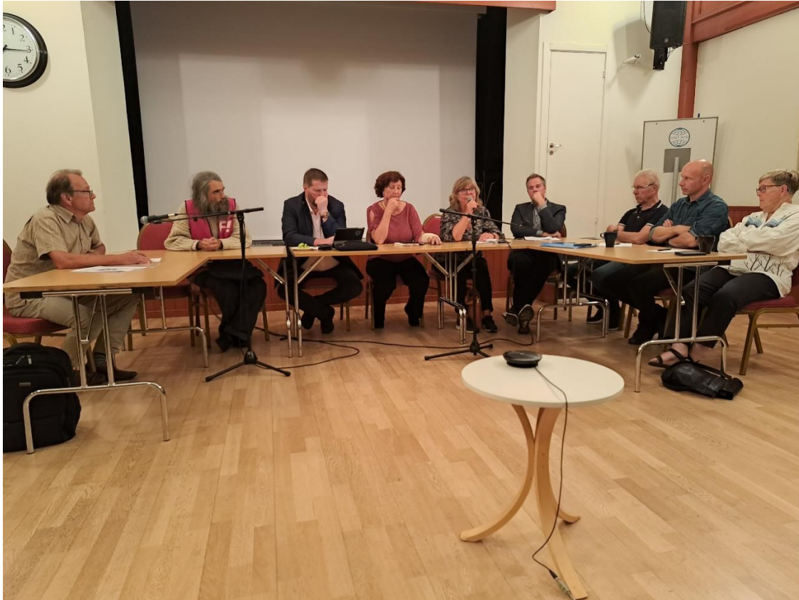
Politikerutfrågning inför valet på Ordenshuset i Umeå